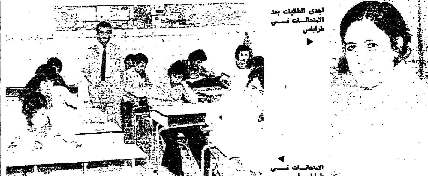
احدى الطالبات بعد الامتحانات في طرابلس

الموضوعة لها، تبقي على روحيتها وان كانت تزيح منها كل ما يعيق النظر ويجيب الرؤية ويسبب الاختناق السكاني.